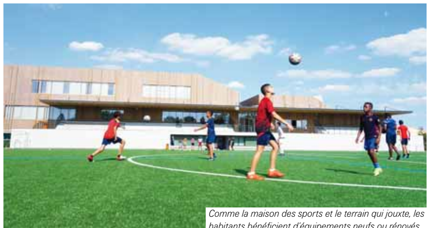
Comme la maison des sports et le terrain qui jouxte, les habitants bénéficient d'équipements neufs ou rénovés