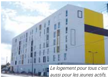
Le logement pour tous c'est aussi pour les jeunes actifs.

D. L. : C'est une impression fautive. Le PLU prévoit justement de préserver le tissu pavillonnaire. La quasi-totalité des projets se situe sur les grands axes de circulation. Il s'agit de commerces, d'équipements, mais surtout de logements dans une région qui, je le rappelle, connaît un déficit de 600 000 logements et un pays qui compte 200 000 logements insalubres. Certaines villes souhaitent conserver leur « qualité de vie » en ne construisant pas et surtout pas pour toutes les catégories sociales. Ici, je le réaffirme, ce n'est pas le cas. Nous sommes une ville ouverte et donc avec du logement pour tous. 65 % des constructions sont en accession. Le reste est bien sûr du locatif social mais aussi de l'accession sociale. Sur ce dernier point, nous avons fait un effort particulier pour permettre au plus grand nombre de devenir propriétaires, les Bezonnais en priorité.