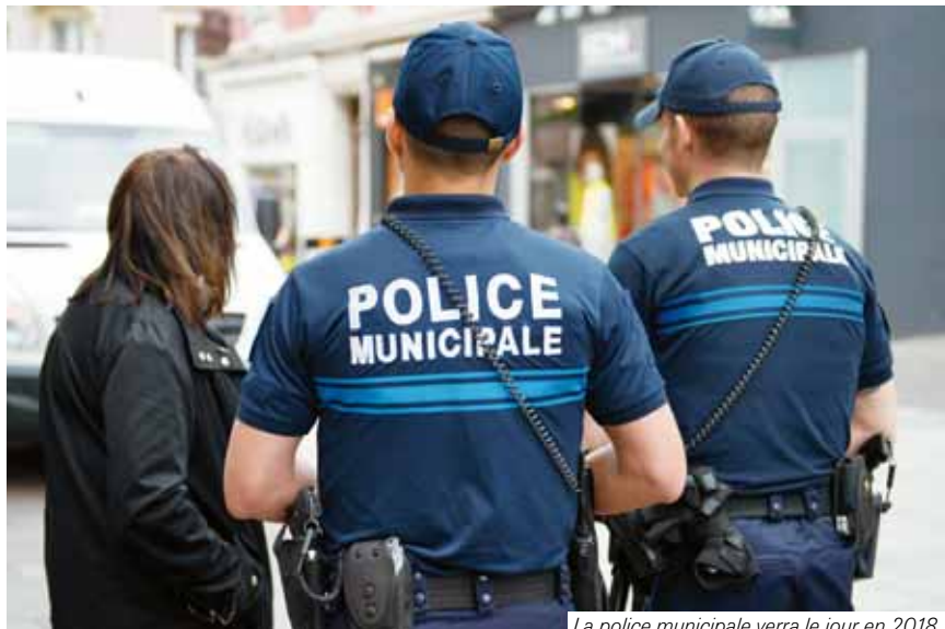
La police municipale verra le jour en 2018.

puissions être dotés de la police de sécurité du quotidien remise au goût du jour par le ministère de l'Intérieur l'été dernier. Le travail est en cours avec les services de la préfecture. Les experts parlent et nous devons écouter, c'est une curieuse façon de faire mais nous espérons que notre voix soit entendue. Nous attendons avec impatience la liste des villes lauréates parce que cela correspond à l'idée que nous nous faisons du travail de la police. Cette proximité, cette connaissance du terrain et des habitants sont aussi indispensables que le