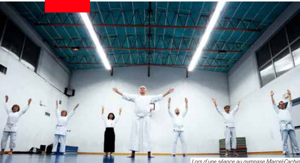
Lors d'une séance au gymnase Marcel-Cachin.