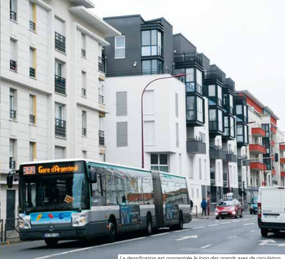
La densification est concentrée le long des grands axes de circulation.