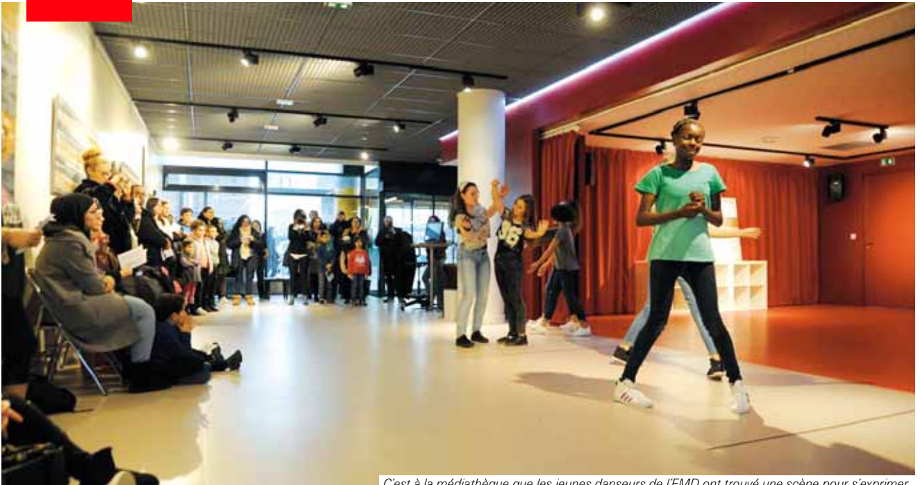
C'est à la médiathèque que les jeunes danseurs de l'EMD ont trouvé une scène pour s'exprimer.