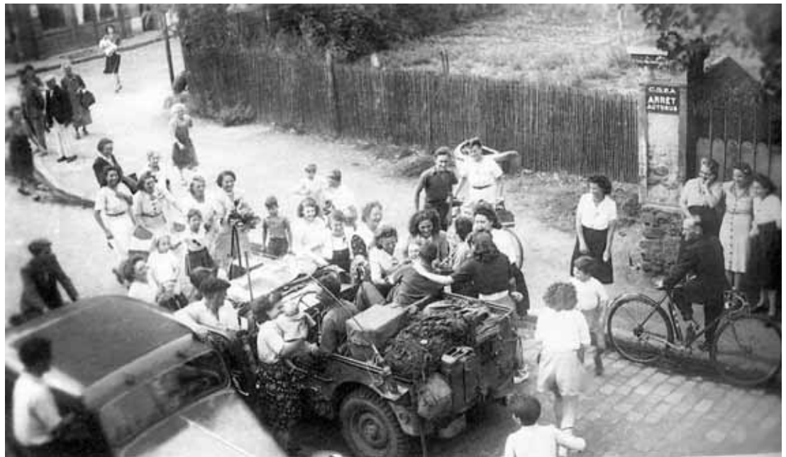
Les Bezonnais accueillent les soldats alliés rue Édouard-Vaillant, angle rue Maurice-Berteaux.

Des familles en grande détresse écrivent au maire et au préfet en ultime recours