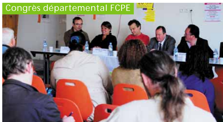
Congrès départemental FCPE