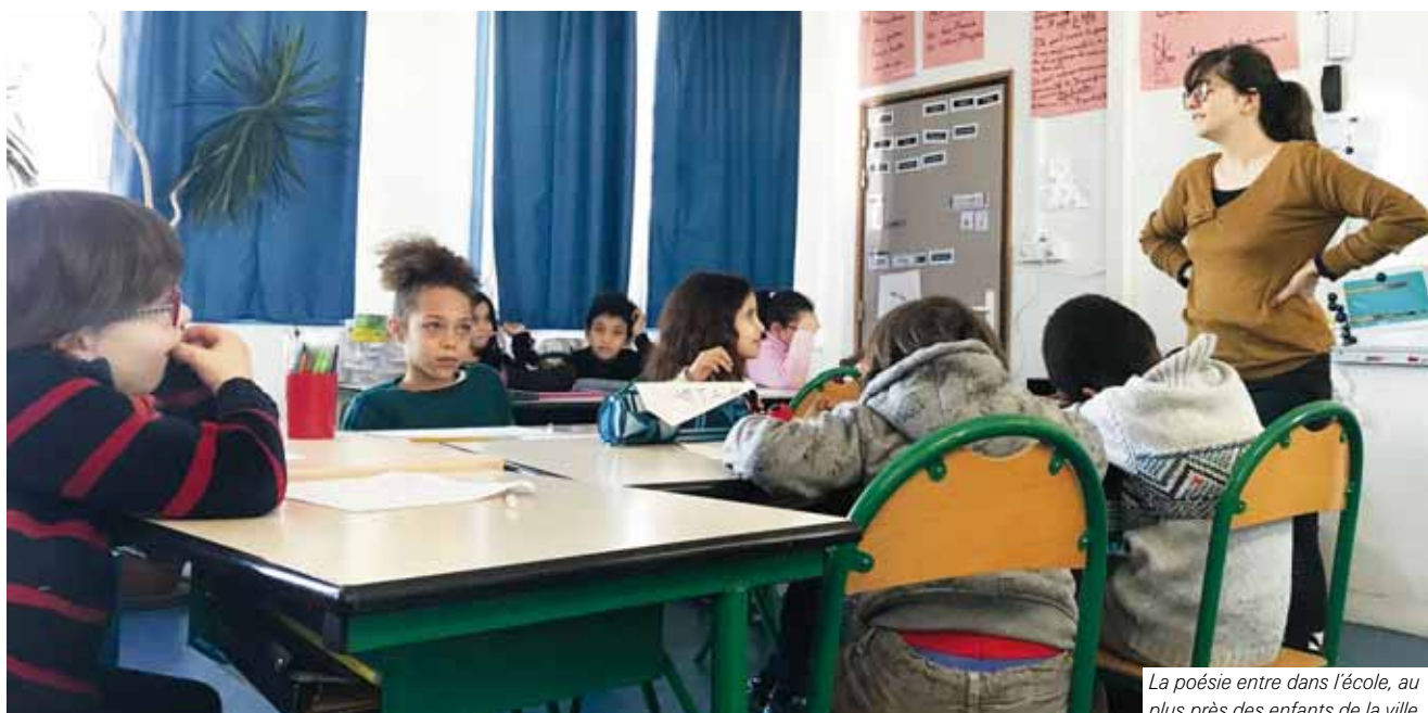
La poésie entre dans l'école, au plus près des enfants de la ville.