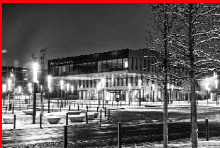
Bezons sous la neige et nuit blanche pour l'hôtel de ville par Abdelmajid Elfaquer.