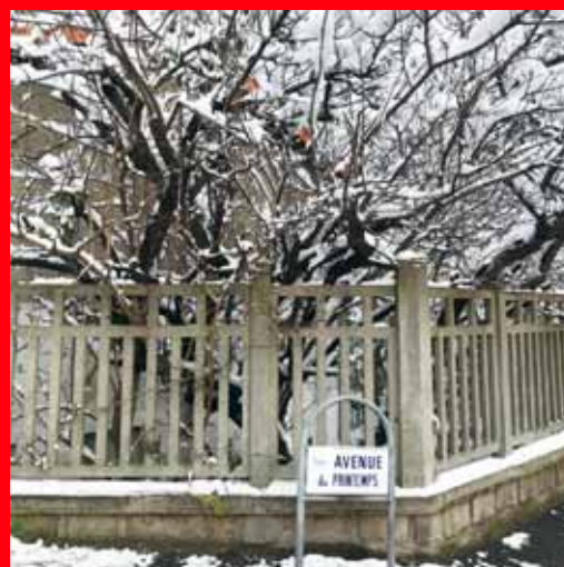
Avenue du Printemps, les arbres ont revêtu leurs habits d'hiver.