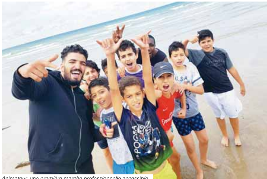
Animateur, une première marche professionnelle accessible.

Plutôt que de financer des brevets d'aptitudes aux fonctions d'animateur (Bafa) pour des 16-25 ans à l'extérieur, la ville et son service jeunesse souhaitent prochainement organiser une session à domicile. C'est le moment de vous manifester.