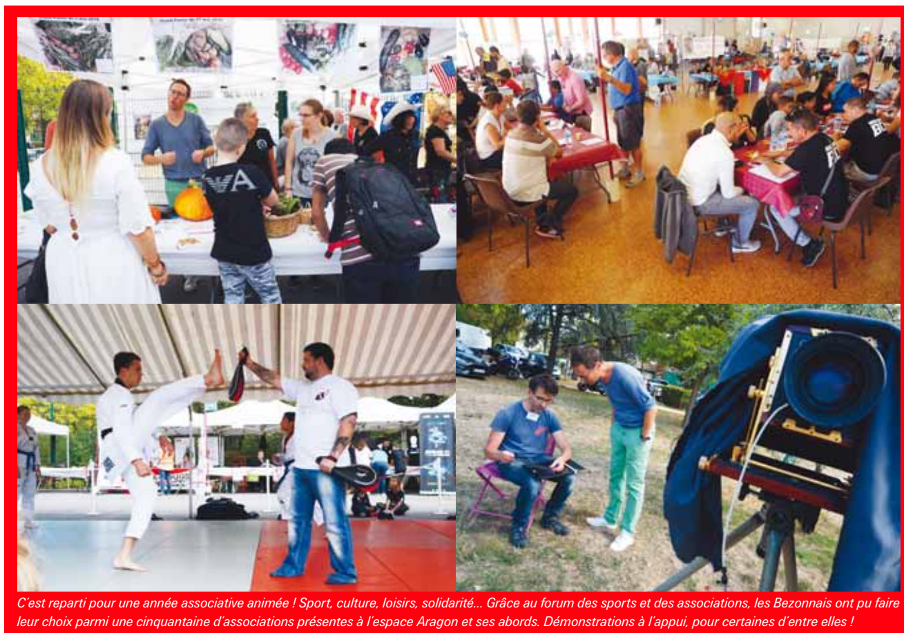
C'est reparti pour une année associative animée ! Sport, culture, loisirs, solidarité... Grâce au forum des sports et des associations, les Bezonnais ont pu faire leur choix parmi une cinquantaine d'associations présentes à l'espace Aragon et ses abords. Démonstrations à l'appui, pour certaines d'entre elles !