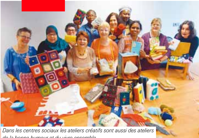
Dans les centres sociaux les ateliers créatifs sont aussi des ateliers de la bonne humeur et du vivre ensemble.