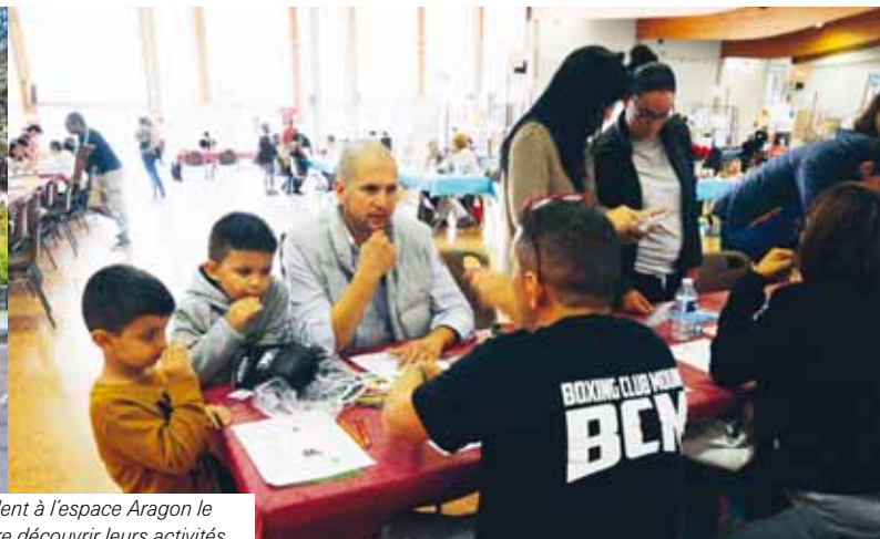
Près de 50 associations vous attendent à l'espace Aragon le 8 septembre prochain pour vous faire découvrir leurs activités.