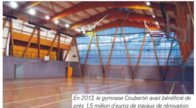
En 2013, le gymnase Coubertin avait bénéficié de près 1,5 million d'euros de travaux de rénovation.

« Une cellule de crise se réunit régulièrement pour travailler à des alternatives provisoires, le temps de l'enquête, du travail des assurances, de leurs experts et de la reconstruction de l'équipement... » soulignait le maire de Bezons lors du rassemblement du 2 juin dernier.