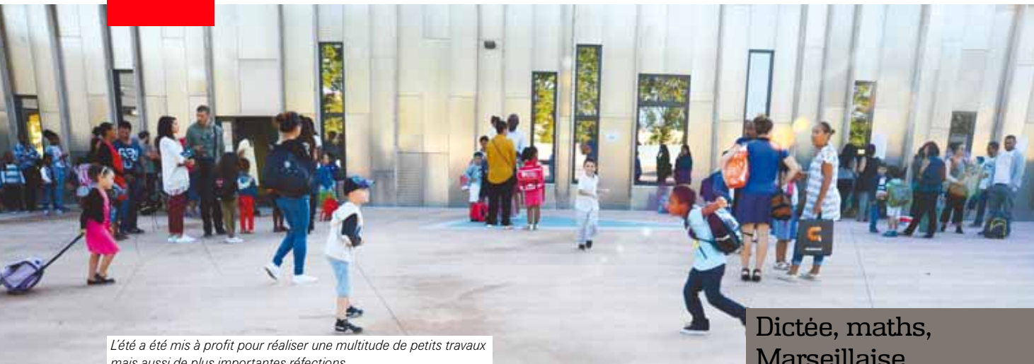
L'été a été mis à profit pour réaliser une multitude de petits travaux mais aussi de plus importantes réfections.

L a Caisse des écoles de Bezons, subventionnée par la commune pour faciliter le fonctionnement au quotidien des classes, assure, entre autres, l'achat de livres, cahiers, gommes, crayons, papier... ce qui permet de réduire la liste des fournitures demandées aux parents d'élèves et ainsi le coût à la charge des familles.