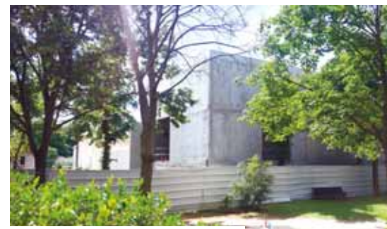
L'espace sportif du Val sera livré fin 2019