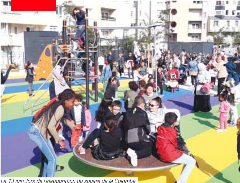
Le 13 juin, lors de l'inauguration du square de la Colombe