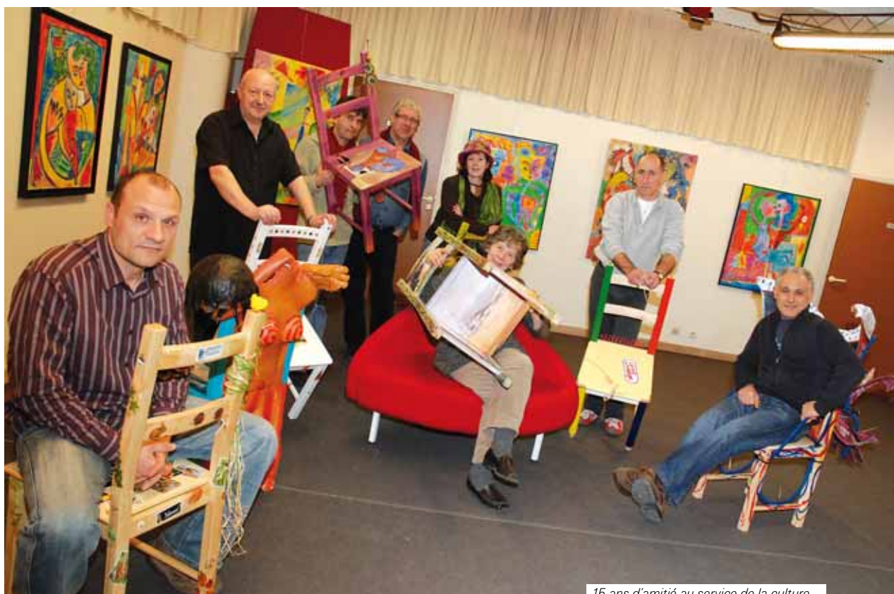
15 ans d'amitié au service de la culture.

L e collectif de plasticiens souffle ses quinze bougies. Quinze années d'amitié, de complicité et d'événements partagés, mues par une même idéologie : faire vivre la culture, jusqu'à devenir un véritable réseau social et créatif sur la ville.