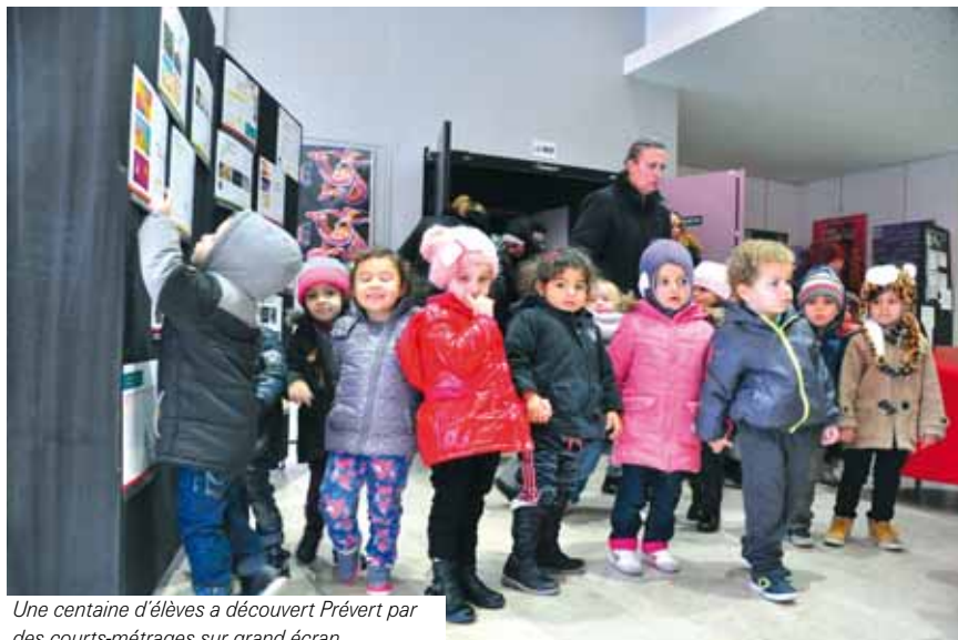
Une centaine d'élèves a découvert Prévert par des courts-métrages sur grand écran.

Petit spectateur deviendra grand ! Comme tous les enfants scolarisés à Bezons, les élèves de maternelle ont la possibilité de se rendre au TPE, voir trois spectacles dans l'année, soit un par trimestre.