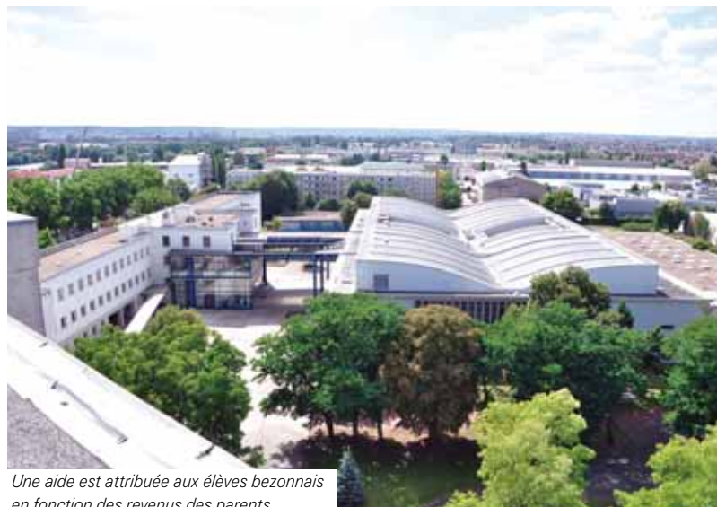
Une aide est attribuée aux élèves bezonnais en fonction des revenus des parents.

M. V. : Notre action ne se limite pas à apporter une aide financière. Aider à franchir un cap difficile, oui. Installer la personne aidée dans l'assistance permanente, non. Les trois assistantes sociales du CCAS assurent un suivi social qui tient compte de la problématique globale de la personne. Bezons est une ville sociale et le restera. Mais l'aide n'est pas un dû automatique, sans conditions. Face à un problème de surendettement, il ne faut pas simplement apurer mais aider les gens à maîtriser leur budget.