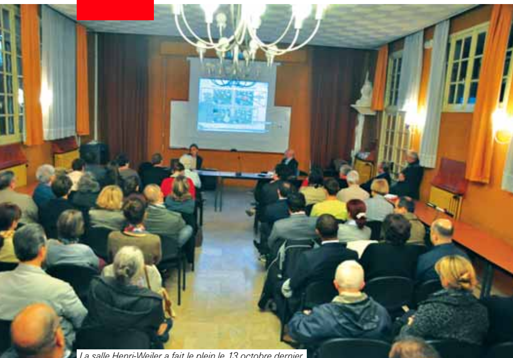
La salle Henri-Weiller a fait le plein le 13 octobre dernier.