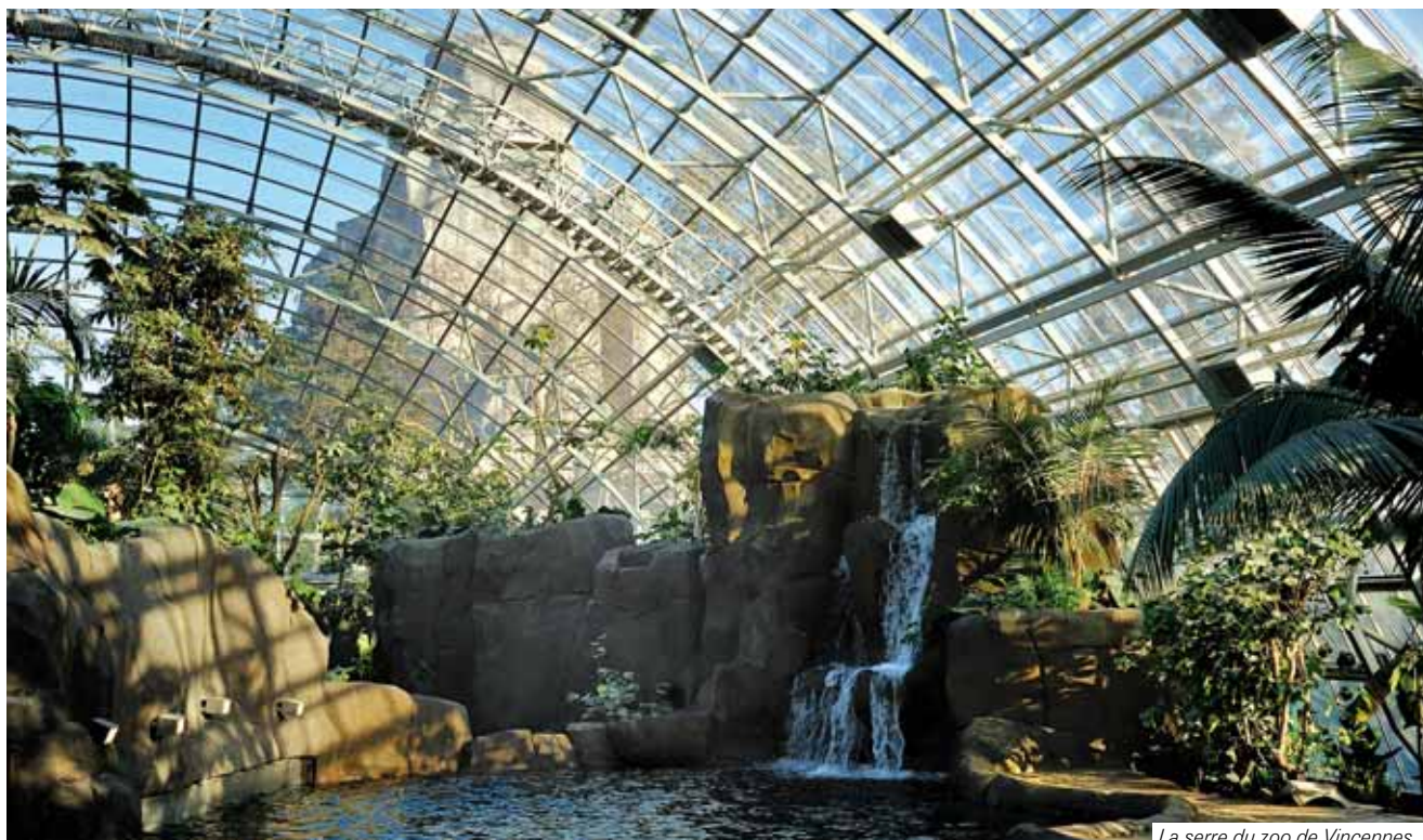
La serre du zoo de Vincennes