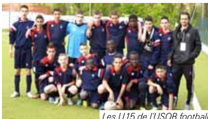
Les U15 de l'USOB football.