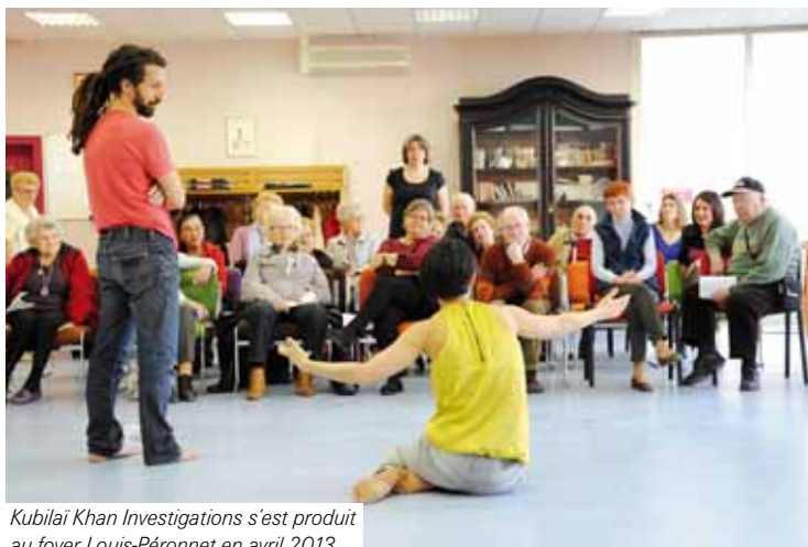
Kubilai Khan Investigations s'est produit au foyer Louis-Péronnet en avril 2013.