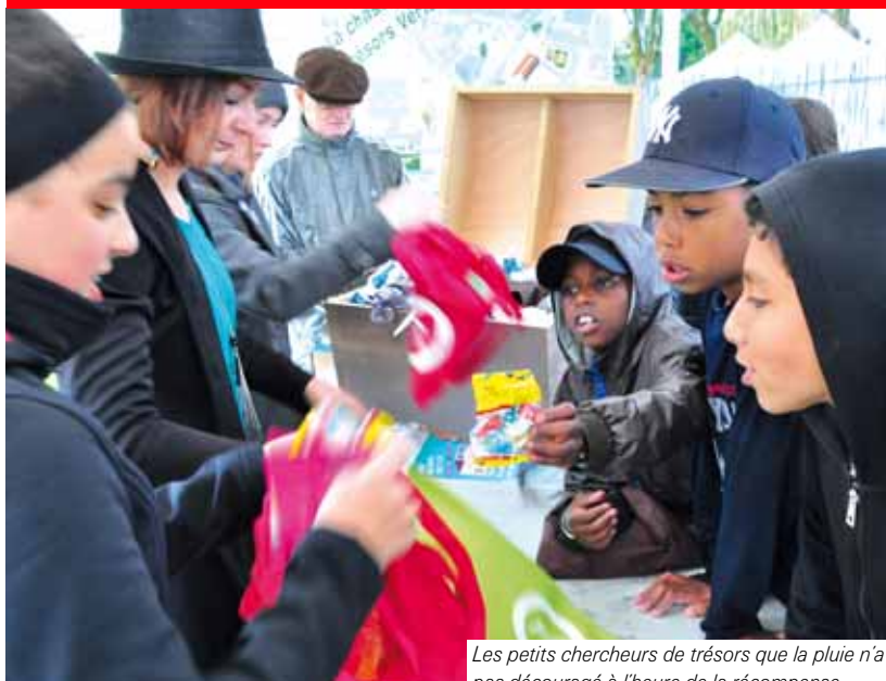
Les petits chercheurs de trésors que la pluie n'a pas découragé à l'heure de la récompense...