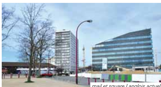
mail et square Langlois actuels

Le square, en bout de mail, sur le thème de « l'île au trésor » entre dans le concept, avec