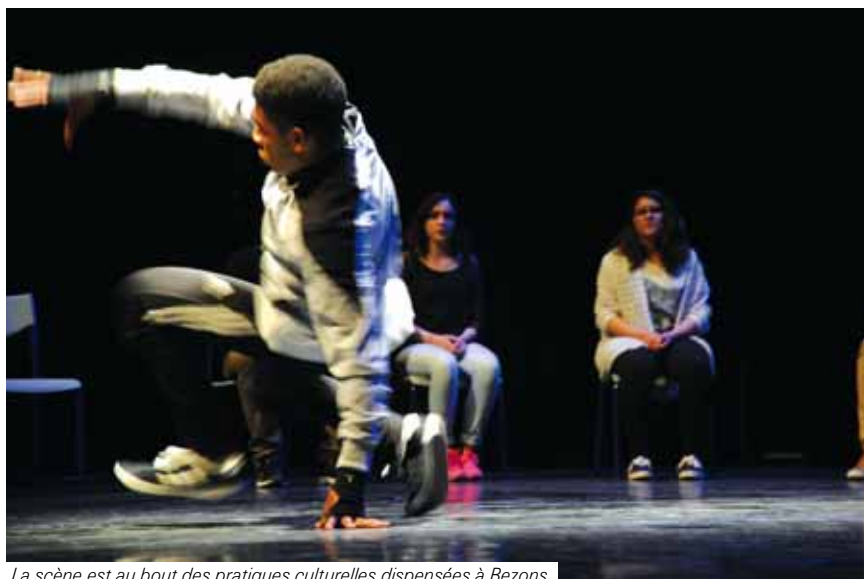
La scène est au bout des pratiques culturelles dispensées à Bezons.

Après les spectacles de fin d'année de l'école de musique, les jeunes des ateliers du TPE ont goûté à la scène.