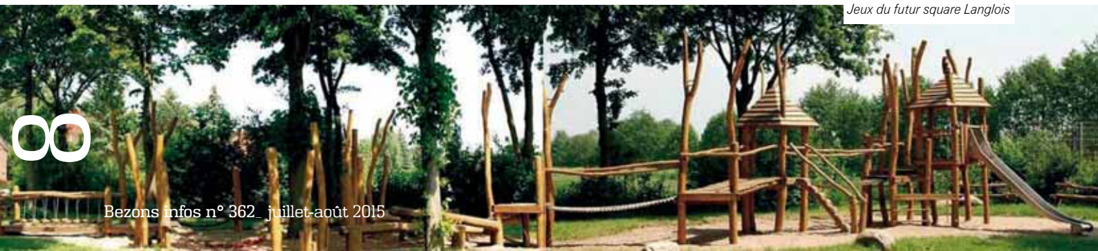
Jeux du futur square Langlois