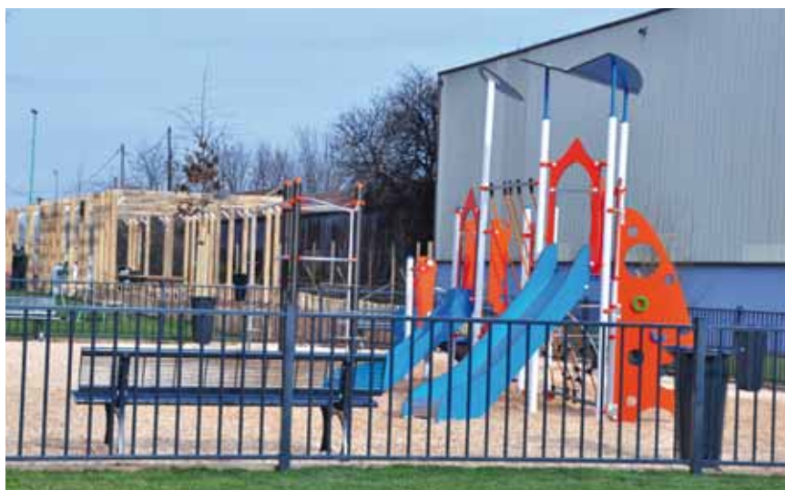
L'actuel parc Mandela

Le 1 er mars 2014, le parc Nelson-Mandela était inauguré le long de la rue Jean-Carasso. Quinze mois plus tard, la phase 2 démarre. Cet agrandissement de 5567 m 2 est compris entre l'entrepôt et la nouvelle boucle de la départementale 311 (en cours de chantier) jusqu'aux berges. Il sera clôturé avec le même matériau. Une allée ira de l'actuel parc jusqu'à la Seine. Cet espace accueillera également du gazon, des plantations, des toilettes publiques et une plateforme béton, en forme de belvédère, en bord de fleuve. Des arbres borderont la bretelle routière. Le chemin de halage, lui, sera refait sur toute l'emprise. L'enveloppe, à la charge de l'agglomération, s'élève à 1,2 million d'euros. L'ouverture du nouvel espace vert est prévue en octobre. À noter que les études pour la phase 3, située à l'est, sur un périmètre passant sous le pont, sont en cours.