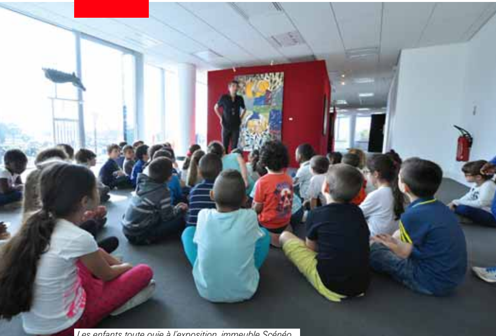
Les enfants toute ouïe à l'exposition, immeuble Scénéo.