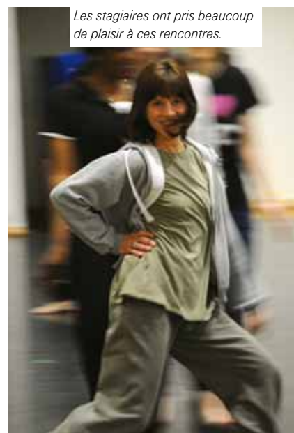
Les stagiaires ont pris beaucoup de plaisir à ces rencontres.