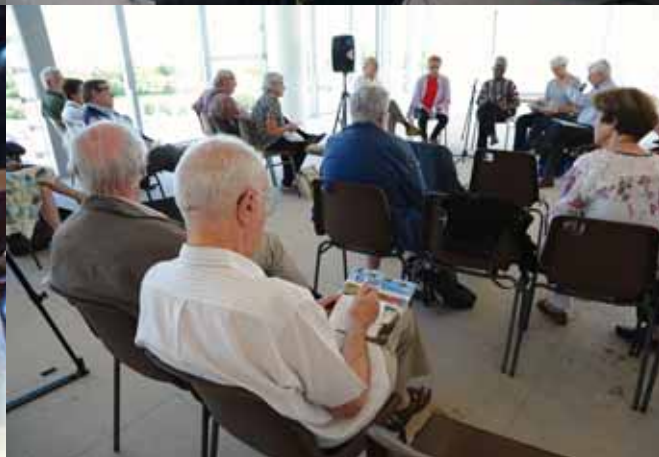
C'est dans la diversité et les vœux de paix qu'AfricaBezons a fêté ses 10 ans.