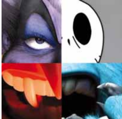
Quels monstres se cachent derrière ces photos ? Réponse le 18 octobre !

« Ciné Kid », à la médiathèque, c'est tous les deux mois, en alternance avec les « Heures du conte numérique ». Le samedi 18 octobre, à 10 h 30, les enfants (à partir de 4 ans) ont rendez-vous avec leurs parents pour un « Ciné Kid » dédié à la peur dans le cinéma pour enfants. Après Noël, la nature et la poésie, place aux monstres et autres cauchemars.