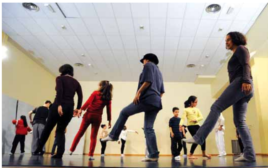
Les stages du TPE connaissent une belle affluence, comme ici en novembre 2012.