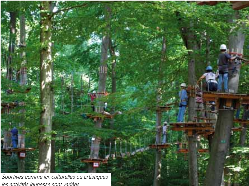
Sportives comme ici, culturelles ou artistiques les activités jeunesse sont variées.

Le service municipal de la jeunesse (SMJ) a concocté un beau programme pour les vacances d'automne. Le Pass « spécial Halloween » devrait plaire aux 11-17 ans.