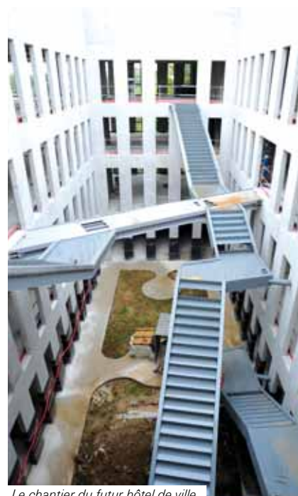
Le chantier du futur hôtel de ville.

Cette question a été un enjeu principal des élections municipales. Les électeurs ont choisi de me réélire avec une équipe de large rassemblement, dès le 1 er tour, pour la mener à bien.