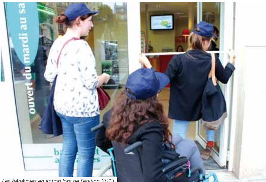
Les bénévoles en action lors de l'édition 2013

Le samedi 11 octobre, la journée de l'accessibilité se déroulera à Bezons pour la première fois. Objectif : recenser les commerces où tout le monde peut se rendre.