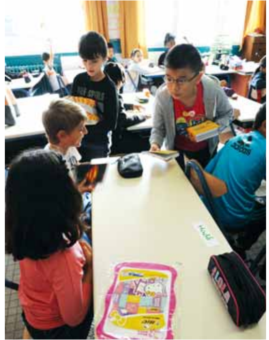
Mardi 2 septembre. - Jour de rentrée à l'école Marcel-Cachin dans le quartier des Bords-de-Seine. Enfants, parents, enseignants et personnels ont repris leurs habitudes.