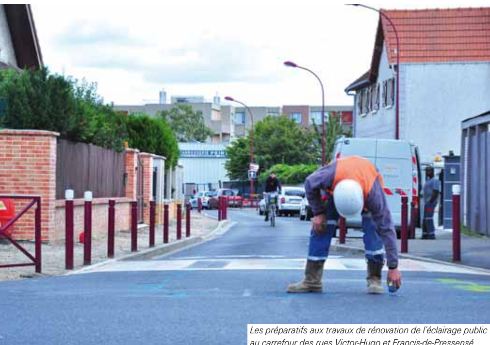
Les préparatifs aux travaux de rénovation de l'éclairage public au carrefour des rues Victor-Hugo et Francis-de-Pressensé