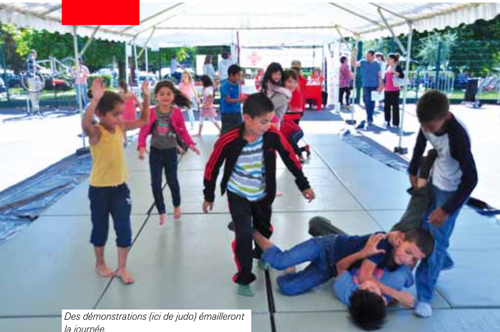
Des démonstrations (ici de judo) émailleront la journée.

Elles étaient 47 associations en 2013. Elles seront une cinquantaine cette année. Le forum des sports et des associations, troisième édition commune consécutive, continue de monter en puissance. On ne change pas une équipe qui gagne : les stands des associations seront disséminés à l'extérieur et l'intérieur de l'espace Aragon, les animations et démonstrations à proximité sur les terrains de tennis.