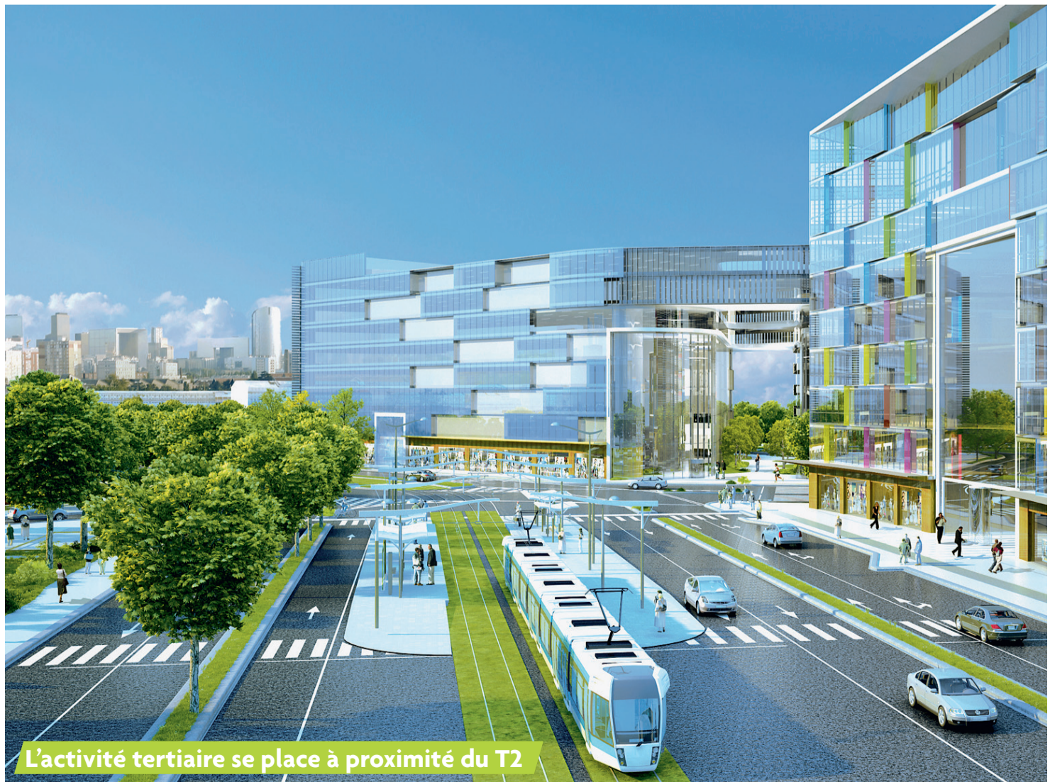
L'activité tertiaire se place à proximité du T2

À noter que, pendant les travaux, l'accès au chantier se fera par la RD 308, pour limiter l'intrusion des camions sur la rue Maurice-Berteaux.