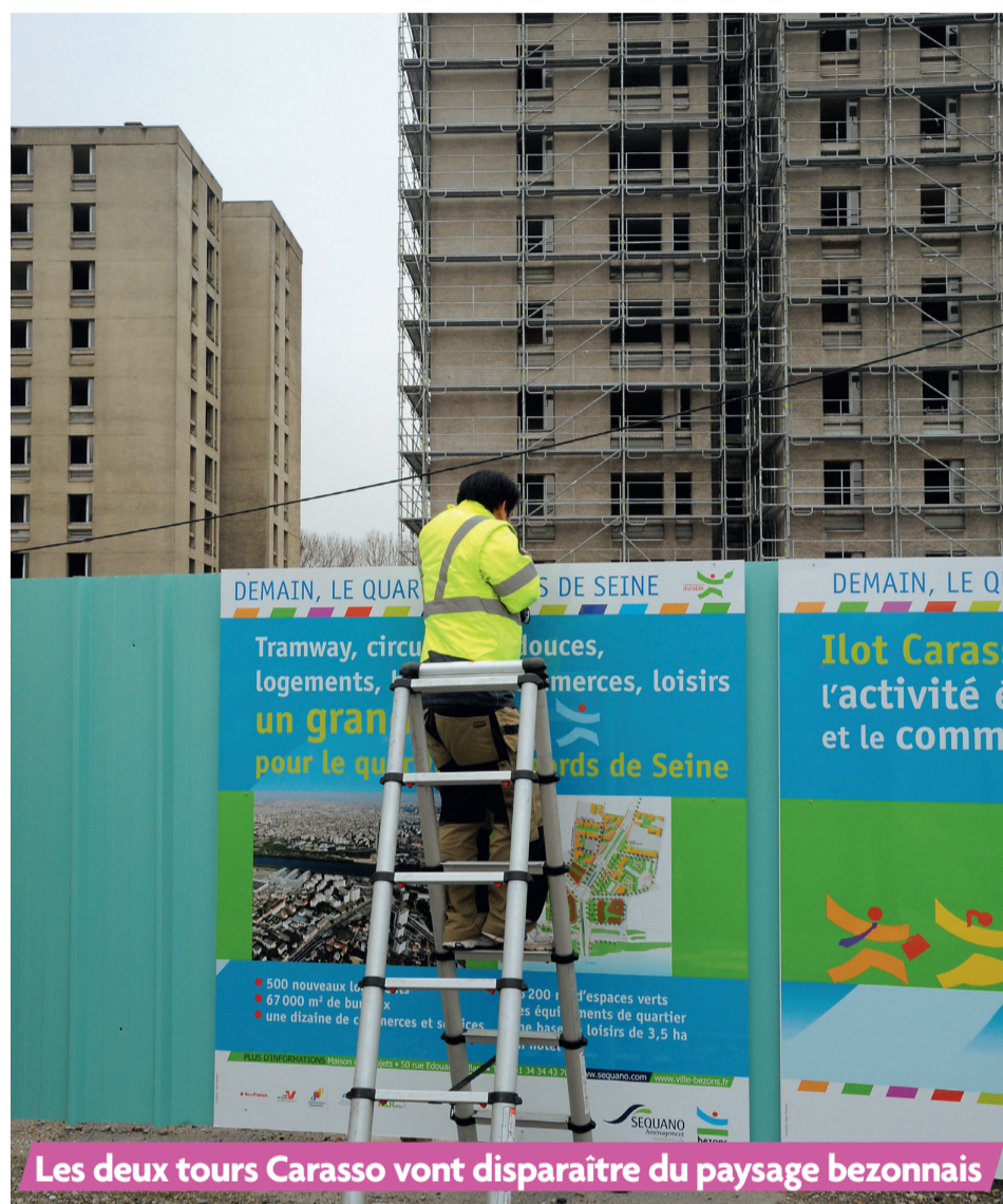
Les deux tours Carasso vont disparaître du paysage bezonnais