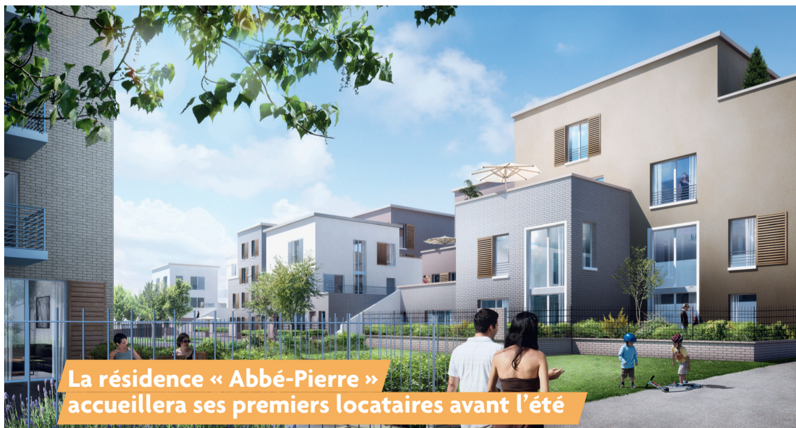
La résidence « Abbé-Pierre » accueillera ses premiers locataires avant l'été