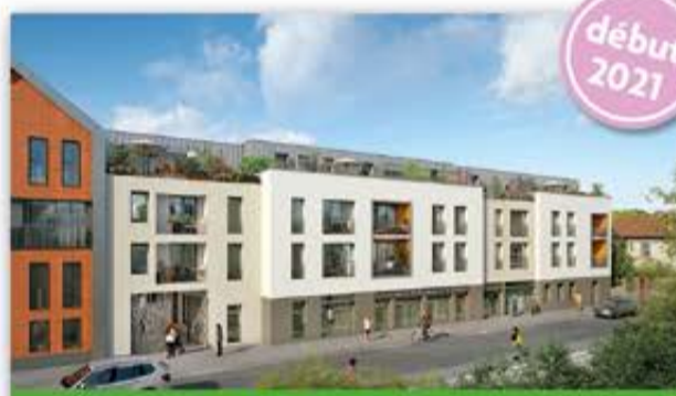
ÉCOLE MUNICIPALE DE MUSIQUE ET DE DANSE

Reconstruite aux dernières normes, à côté de son emplacement actuel, la nouvelle École municipale de musique et de danse aura pignon sur la rue Villeneuve. Elle sera dotée d'un auditorium et d'une salle de danse et s'étendra sur 1000m 2 , soit plus de 30 % de surface supplémentaire.