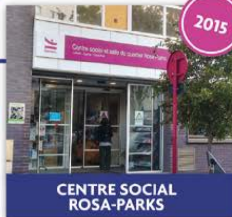
CENTRE SOCIAL ROSA-PARKS