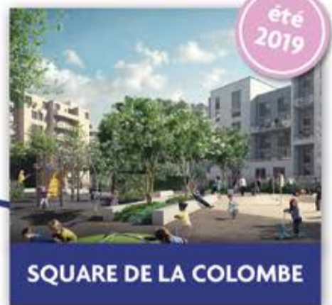
SQUARE DE LA COLOMBE