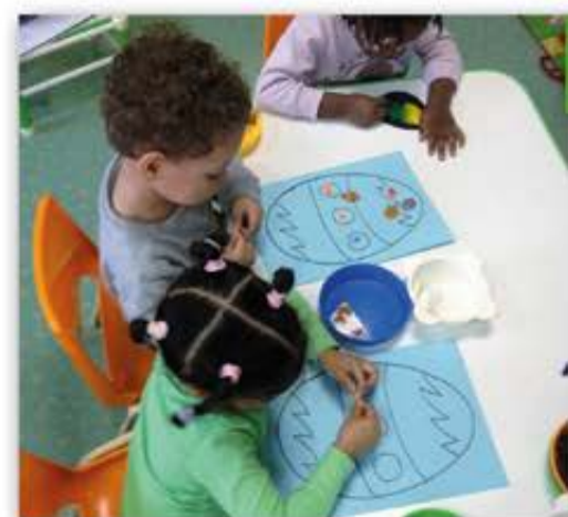
RELAIS ASSISTANT(E)S MATERNEL(LE)S

Les familles bezonnaises et leurs 183 assistant(e)s maternel(le)s pourront se retrouver dans cette nouvelle structure municipale dédiée à la petite enfance.