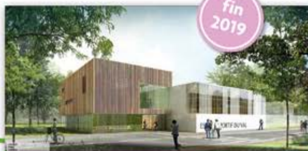
ESPACE DU VAL

Le quartier du Val va bénéficier d'un nouvel équipement municipal. Avec façade sur le parc Sacco-et-Vanzetti, l'Espace du Val sera un bel outil pour les associations, les sportifs et les scolaires.