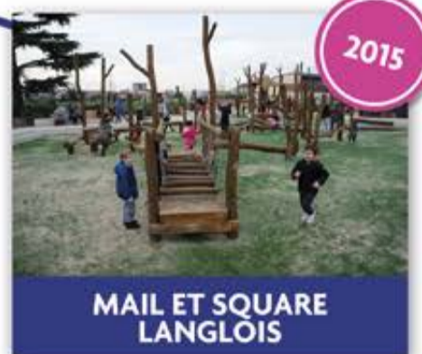
MAIL ET SQUARE LANGLOIS