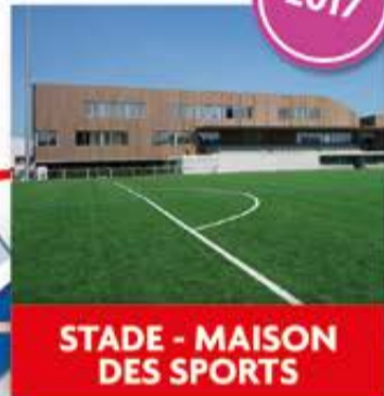
STADE - MAISON DES SPORTS