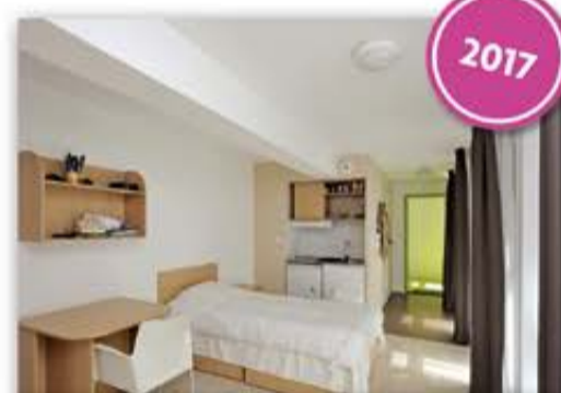
RÉSIDENCES ÉTUDIANTS ET JEUNES ACTIFS

Pour faciliter l'accès au logement des étudiants et jeunes actifs, touchés par la crise du logement, la ville a soutenu l'implantation d'une résidence dédiée rue Émile-Zola. Une nouvelle résidence étudiante est actuellement en cours de construction rue de la Paix.