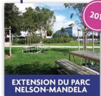
EXTENSION DU PARC NELSON-MANDELA

La rénovation urbaine de l'entrée de ville (ANRU) touche à sa fin. Plusieurs réalisations ont accompagné la création de nouveaux logements, équipements et espaces verts dans ce quartier : la disparition du parking Silo au profit d'un parking souterrain, la création du mail Jacques-Leser pour relier le cœur de ville au quartier et d'un nouveau square. Sont aussi prévus : l'installation, d'ici fin 2019, d'une surface alimentaire au pied de la tour Francisco-Ferrer puis le lancement de la construction du dernier immeuble d'habitation (livraison début 2021). À l'emplacement des tours Carasso, les travaux d'un nouvel immeuble de bureaux ont aussi débuté fin 2018. Le chantier de rénovation du lycée vient également de démarrer.